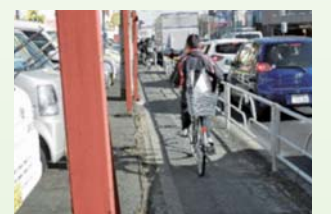
野口橋交差点～国分寺線下の歩道整備を